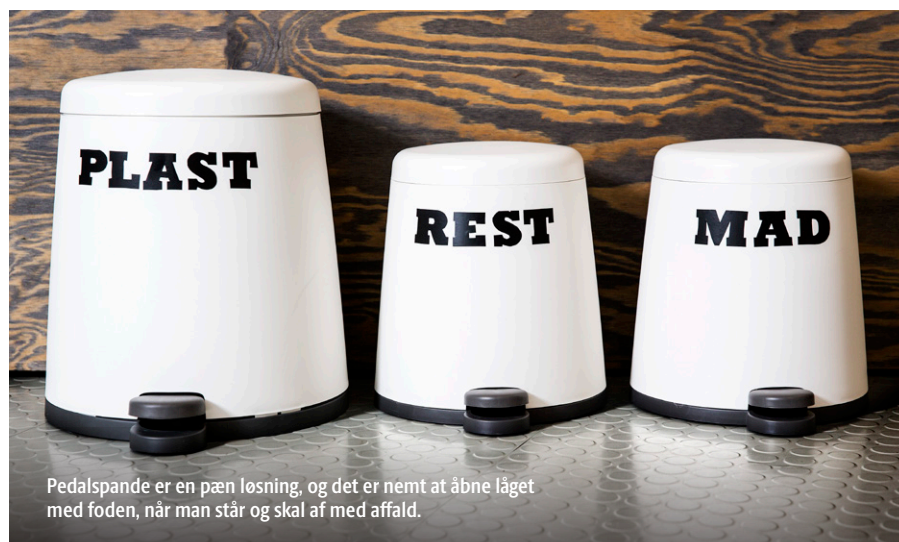
Pedalspande er en pæn løsning, og det er nemt at åbne låget med foden, når man står og skal af med affald.