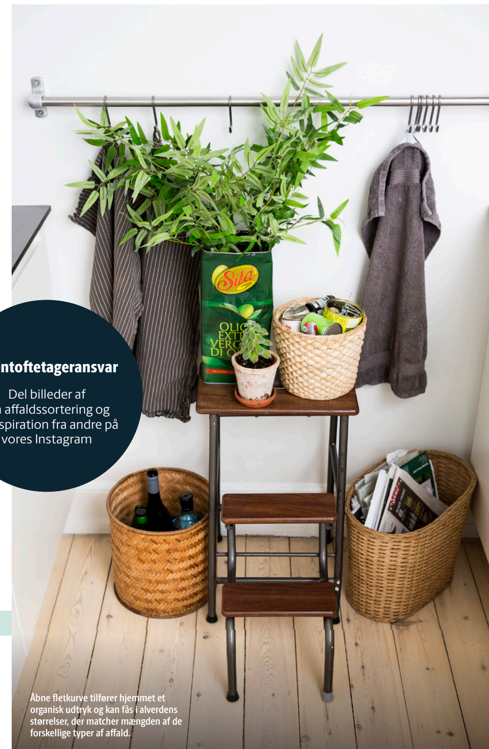
Åbne fletkurve tilfører hjemmet et organisk udtryk og kan fås i alverdens størrelser, der matcher mængden af de forskellige typer af affald.