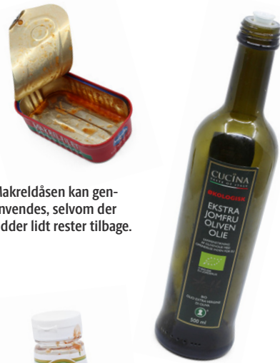
Makrelåsen kan gen-anvendes, selvom der sidder lidt rester tilbage.