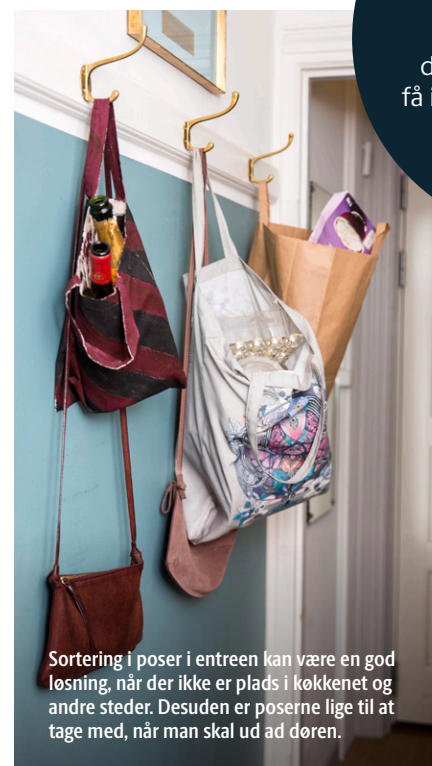
Sortering i poser i entreen kan være en god løsning, når der ikke er plads i køkkenet og andre steder. Desuden er poserne lige til at tage med, når man skal ud ad døren.

Del billeder af din affaldssortering og få inspiration fra andre på vores Instagram