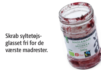
Skrab syltetøjs-glasset fri for de værste madrester.

Glas og beholdere skal tømmes for væske og skrubes fri for de værste madrester. Mærkater må gerne blive siddende på. Tag låget af og sortér det for sig – hvis du kan.