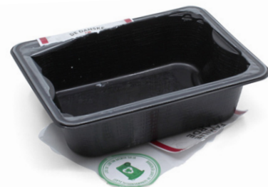
Dryp kødbakken af.