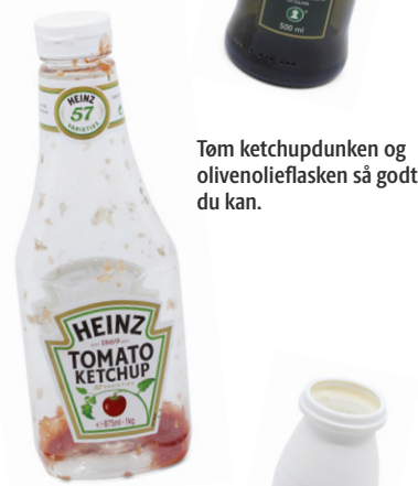
Tøm ketchupdunken og olivenolieflasken så godt du kan.