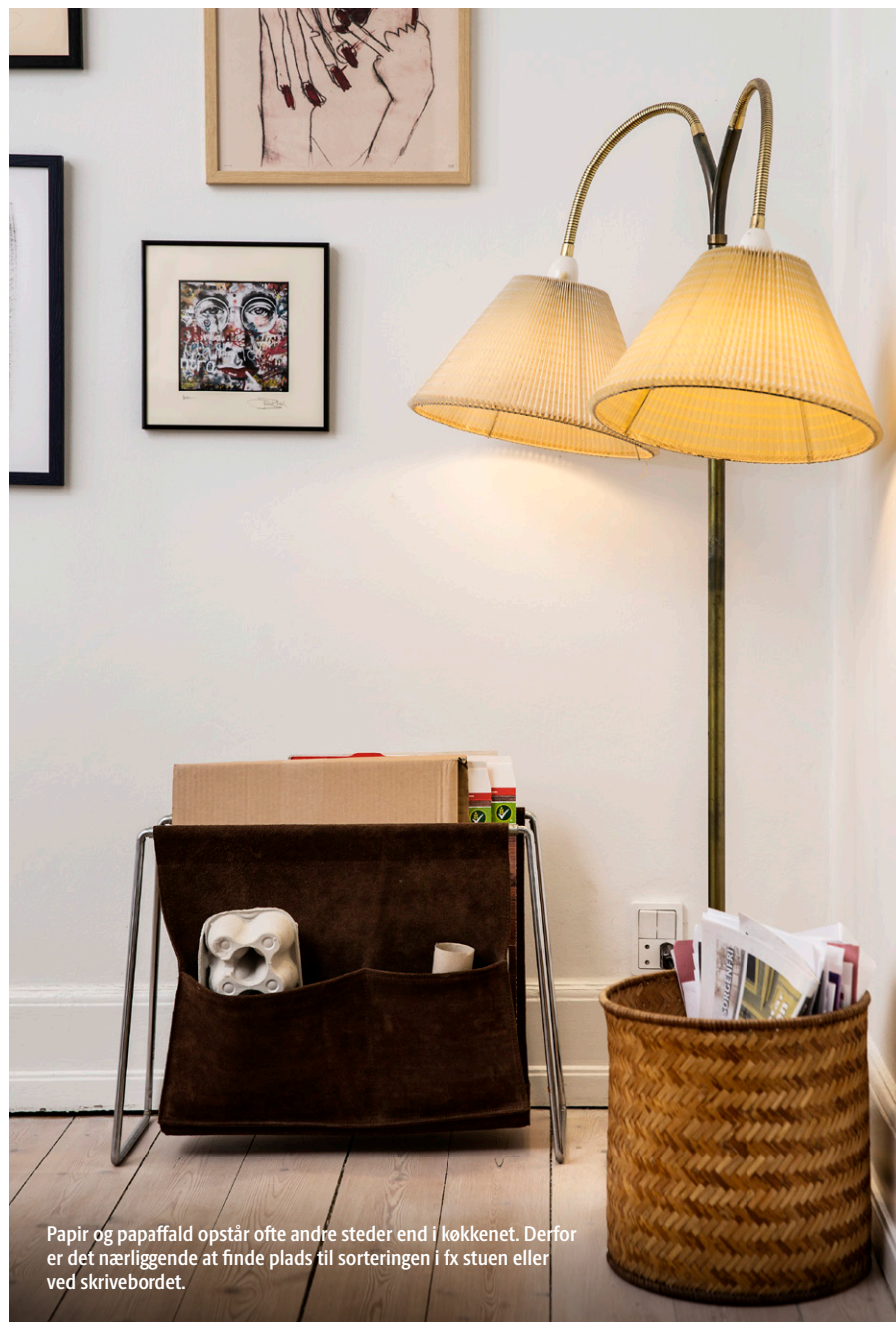
Papir og papaffald opstår ofte andre steder end i køkkenet. Derfor er det nærliggende at finde plads til sorteringen i fx stuen eller ved skrivebordet.

Få hele husstanden med. Det giver en bedre sortering, hvis hele familien tager del. Sæt eventuelt klistermærker, som du har modtaget, på sorteringsbeholderne. Fotografierne gør det nemt at afkode og huske, hvor affaldet skal hen for både små og store. Har du børn, så tag en snak om jeres affaldssortering. Er der affald de er i tvivl om, kan det lægges på køkkenbordet. Så kan I sortere det sammen, når I har tid.